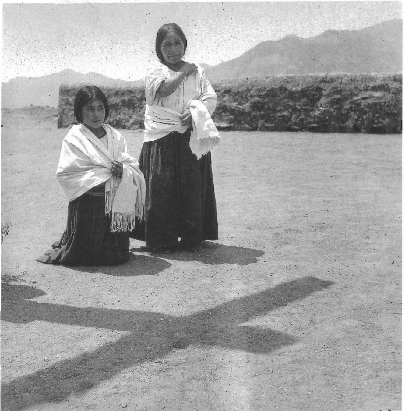
« Indígenas de Ayutla, Oaxaca » in México : Juan Rulfo, fotógrafo , Catálogo de la exposición en el Palau de la Virreina, Barcelona, 20 de abril-2 de septiembre de 2001, Barcelona, Lunwerg Editores, 2001, pág. 135 (ISBN : 84-7782-772-9).